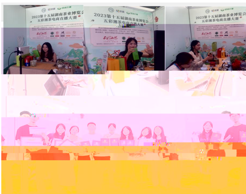
图 “湖南省第十五届茶博会” 电商直播比赛现场

播和方的，短 得的步。 队比10多单、单， 包但不、等多个，的 和队得的高度。的 得不对公的，更对参 付出和的充分定。