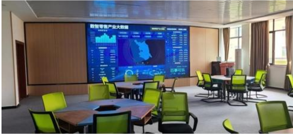
图 智慧零售运营中心