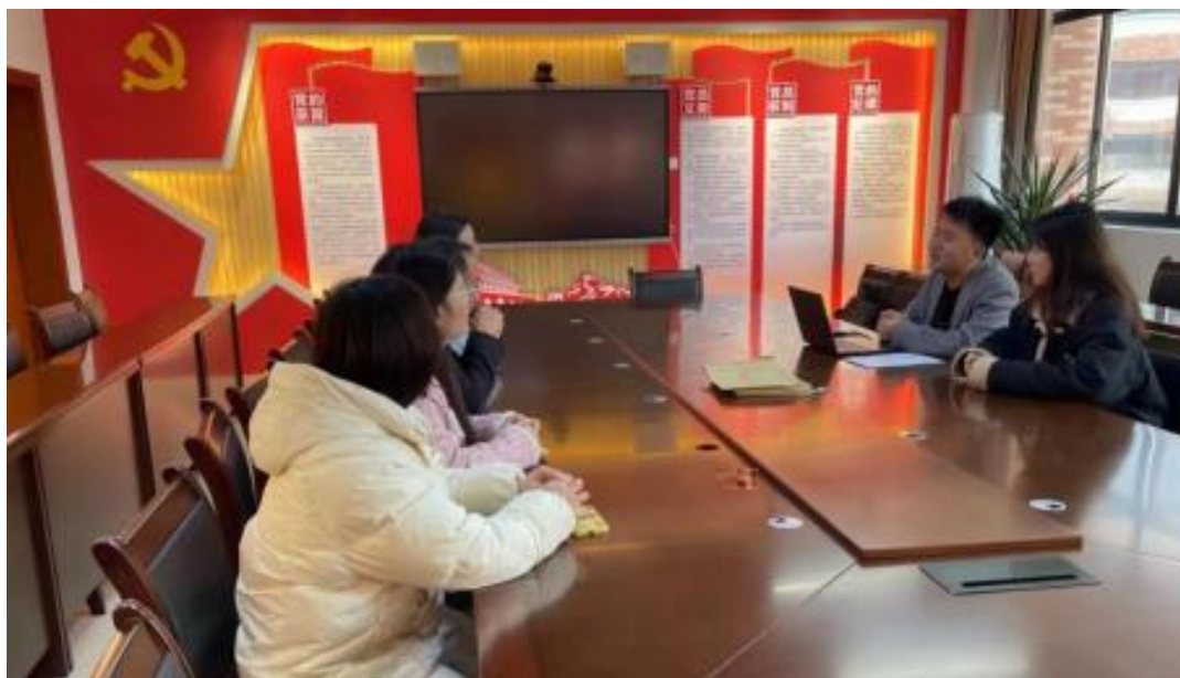
图 校企开展学术研讨项目交流会议

公 高度 队 的 ，充分 到 和 的关 ，对 高 和 关 的 。此公 供 ，包 更 、 方法 及 导 发 程，并 持 丰富 的 家 过 、 会 和 际案 ， 队 分 的 和 。 常 地 活动， 包 参加 会 、 等 ， 促 尚 的 分 ， ， 并 的 队 ( )。