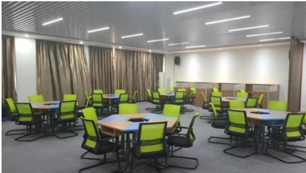
图 智慧零售运营中心