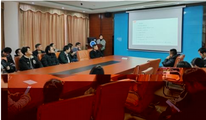
图 员工专业技能培训

，公 促 发 和 才 方 得 成 。 过 创 的 和 ， 不 动 公 的 持 成长， 工 供 的发 机会。 过 供多 化的 和发 ， “ 队 共 ” 等 活动 ( )， 帮 工 ( 技 和管 ； 并 的 和 规划， 工的 合 和 ， 包 导 发 计划、技 技 及 部 等， 地促 工的 方 发 。